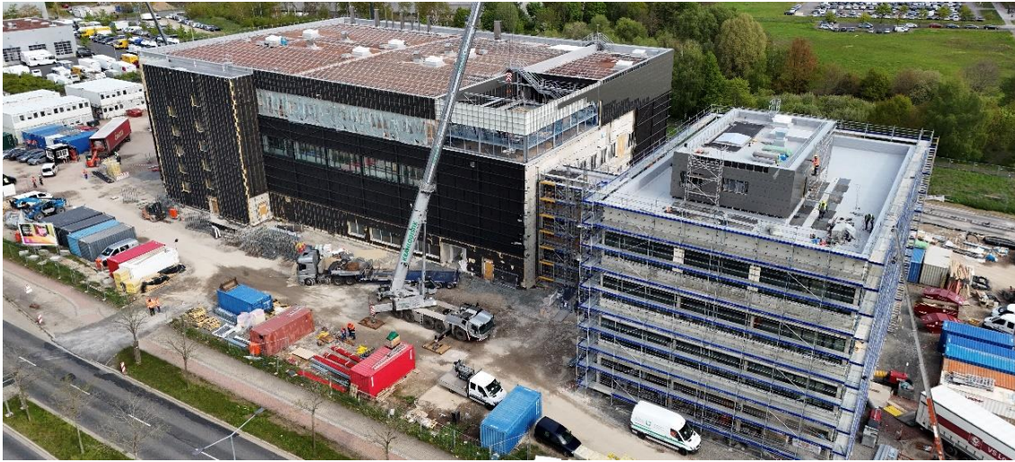
Fabrik in Dresden