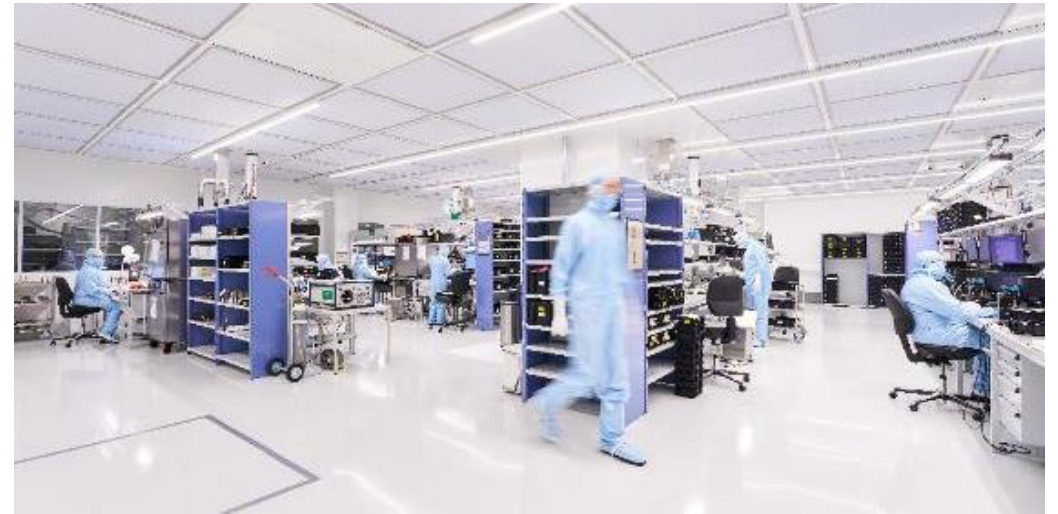
Fabrik in Berlin